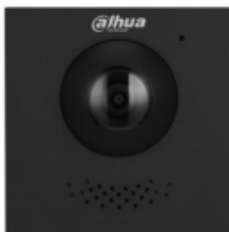
VTO4202FB-P-(S2) Video Intercom Camera Hoofdmodule Antraciet